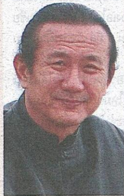
วิกกรม กรมดิษฐ์

จารึกวันแม่แห่งประวัติศาสตร์ สมเด็จพระบรมโอรสาธิราชฯ สยามมกุฎราชกุมาร และ พระเจ้าหลานเธอ พระองค์เจ้าพัชรกิติยาภา ทรงจักรยานนำขบวนประชาชนนับแสนทั่วประเทศ ร่วมกิจกรรมเฉลิมพระเกียรติสมเด็จพระนางเจ้า พระบรมราชินีนาถ "Bike for Mom ปั่นเพื่อแม่" เรียกว่า อิ่มเอมใจกันทั้งประเทศกันเลยทีเดียว!!! ◆◆ พระเจ้าวรวงศ์เธอ พระองค์เจ้าโสมสวลี พระวรราชทินนิตตามาดู เสด็จทอดพระเนตรละครเวที "รอยดูริยางค์ เดอะมิวสิคัล" รอบปฐมทัศน์ ในวันศุกร์ที่ 21 สิงหาคม 2558 เวลา 19.00 น. ณ หอประชุมใหญ่ ศูนย์วัฒนธรรมแห่งประเทศไทย เพื่อ